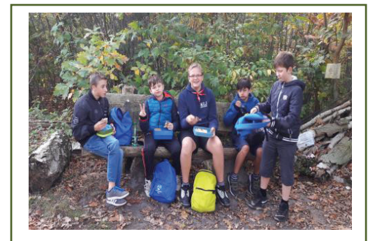
Week van het bos

Je merkt het, in 1B steek je je handen uit de mouwen, ben je vaak op stap en ondervind je dat leren écht wel leuk kan zijn! Sluit je ook aan?