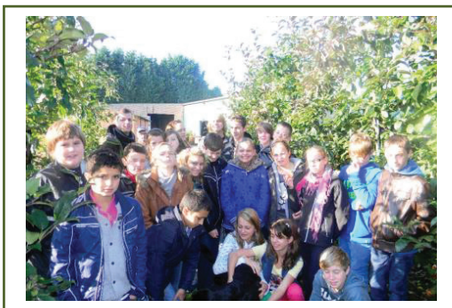
Uitstap naar de appelboer

32 uren brede basisvorming met extra aandacht voor beroepsgerichte vakken en projectmatig werken.