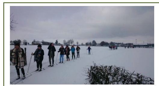
Langlaufen in Malmédy